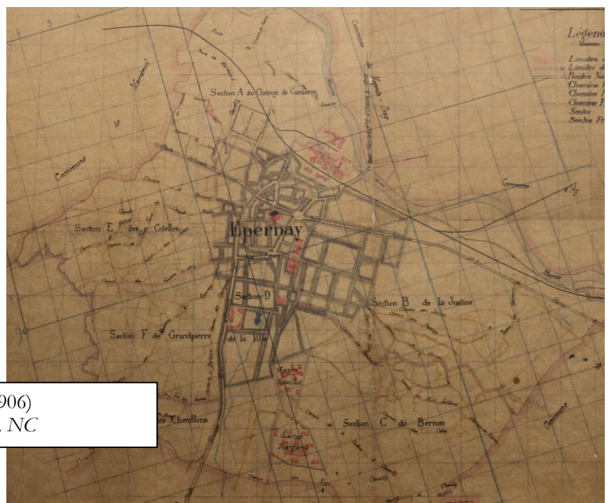
Plan cadastral d'Épernay (1906)

4 – Encerclez en rouge sur la carte ci-contre la partie de la ville où se concentrent le plus les bombardements.