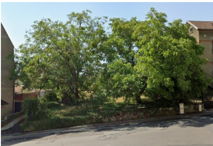
Vue des parcelles depuis la rue des Gouttes d'or