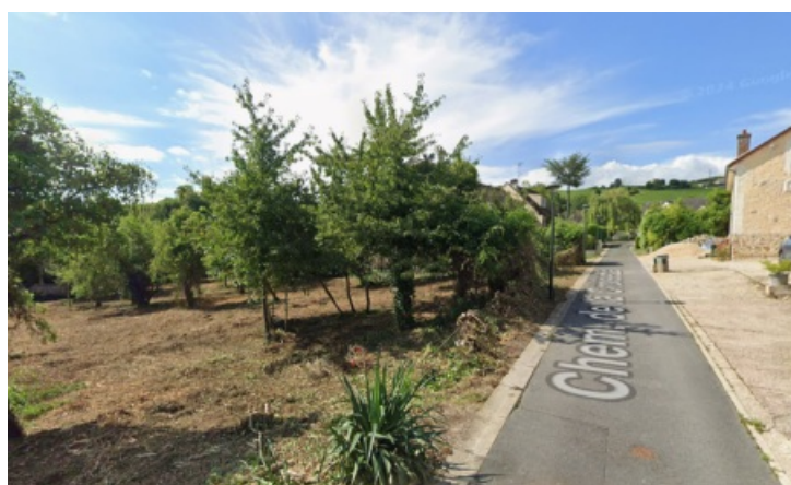
Vue du terrain depuis le chemin de la Croisette