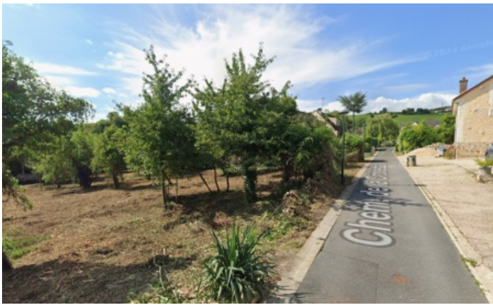
Vue du terrain depuis le chemin de la Croisette