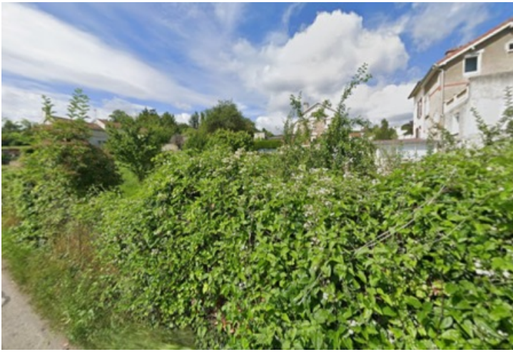
Vue des parcelles depuis le sentier du Platet